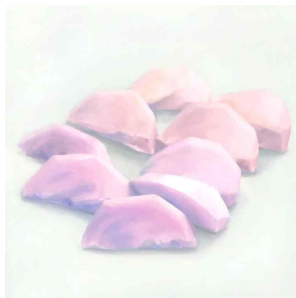
복숭아, 53x53cm, Oil on canvas, 2021